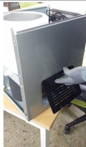
13-2) ハンドルに手を入れて上方に挙げて取り外します。