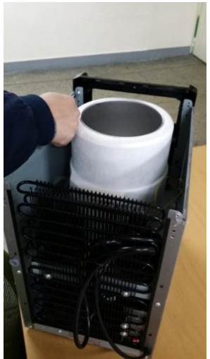
11) 左側にある残りのネジ1個を取り外します。