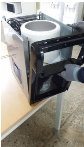
12) 前パネルを取り外します。