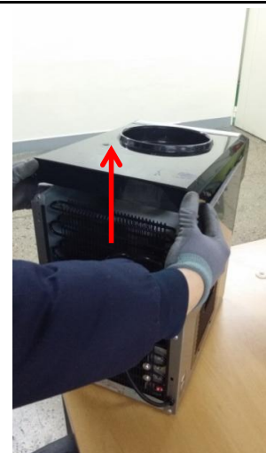
6-2) 上パネルを背面部を前方向に押しながら上にあげます。