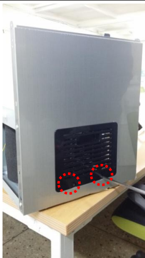
13-1) 側板のグリルのネジを取り外します。