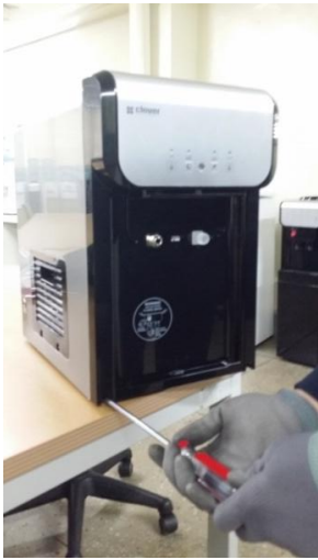
7) 前パネルの下部にあるネジ2個を取り外してください。