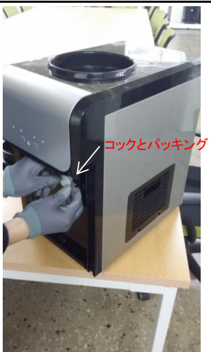
5) 両コックとパッキングを取り外します。