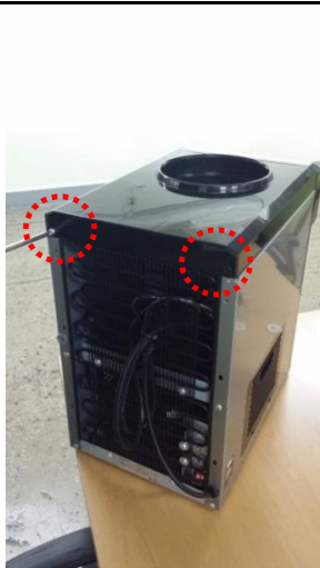
6-1) 上パネルの背面についてあるネジ2個を取り外してください。