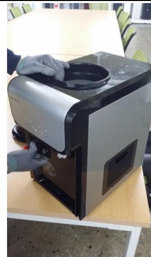
4-2) 温水コックを時計の反対方向に(CCW)回して取り外します。