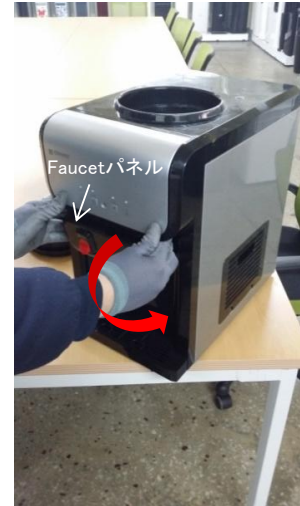
3-1) Faucetパネルを両手で握って下方方向に回す感覚で下方方向に引っ張ります。