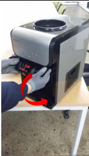
3-2) 最後まで引っ張り回して完全に取り外してください。