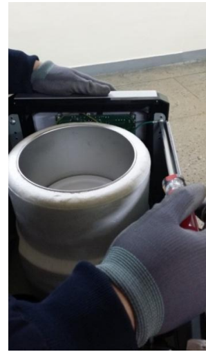
9) 前パネルの内側についているネジを取り外します。