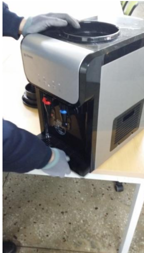
2) 水受皿を取り外します。