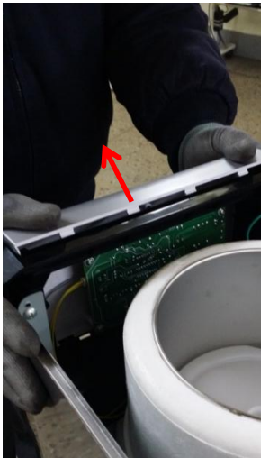
10-1) デコパネルを前に引いて取り外します。