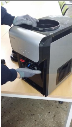
4-1) 冷水コックを時計の反対方向に(CCW)回して取り外します。