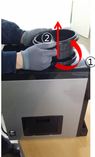
1) N.S.Kを ① OPEN方向に回して ② 上方方向に挙げて取り外します。