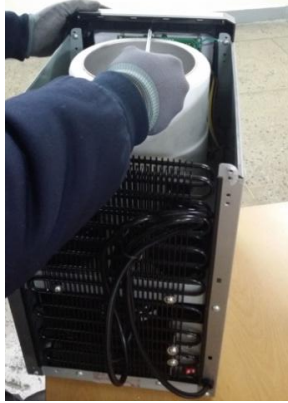
8) デコパネルの内側についているネジを取り外します。