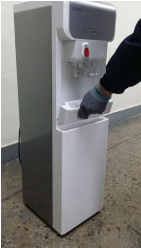
1) 水受皿を上方向に挙げて取り外します。