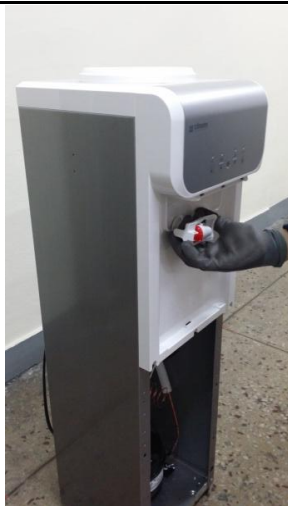
5-2) 温水コックを時計の反対方向に(CCW)回して取り外します。