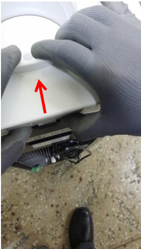
9-1) 上パネルの背面部を押しして隙間を広げます。