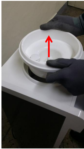
7-2) N.S.Kを上方向に挙げて取り外します。