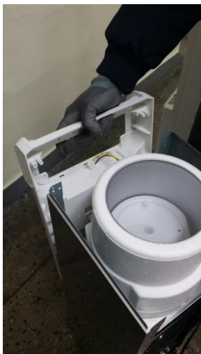
14) 前パネルを取り外します。