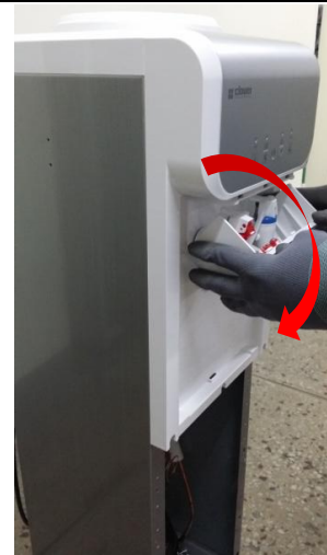
4-2) 最後まで引っ張り回して完全に取り外します。