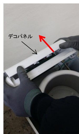
11-2) デコパネルを前方向に押します。