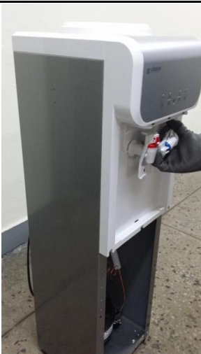
5-1) 冷水コックを時計の反対方向に(CCW)回して取り外します。