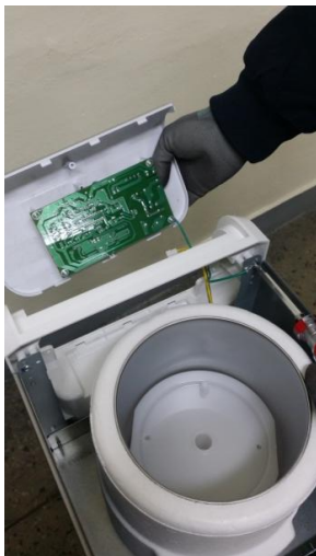
11-4) 前パネルの内側にあるネジ1個を取り外してデコパネルを取り外してください。