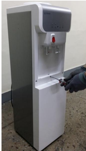
2) ネジ1個を取り外します。