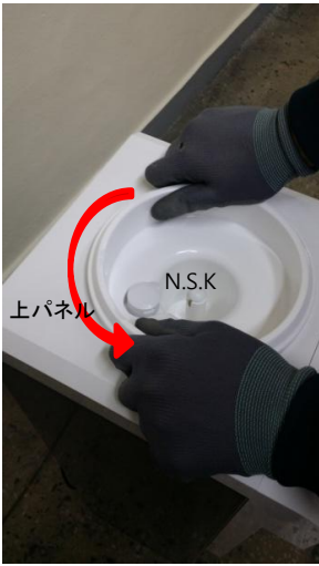
7-1) 上パネルに刻まれている印(▽)にN.S.Kを OPEN方向に回してください。