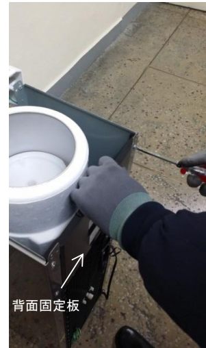
10-1) 背面固定板についているネジ4個を取り外してください。