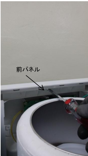
11-1) 製品の内部にある上パネルとデコパネルの固定ネジ1個を取り外します。