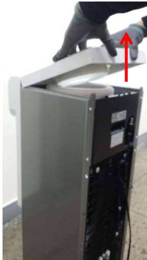
9-2) 広げた状態で上方向に挙げて取り外します。