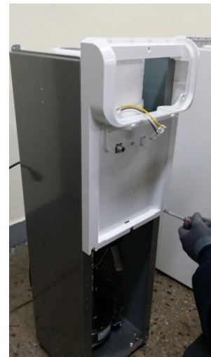
13) 前パネルの外側の下にあるネジ2個を取り外してください。