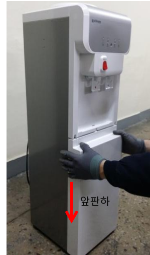
3-1) 下パネルを下方向に押してください。