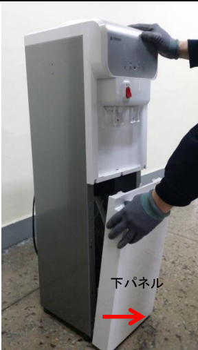
3-2) 製品を少し後ろに傾けた状態で下パネルを自分の方向に引いて取り外します。