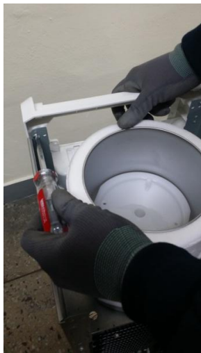
12) 前パネルの内側の左ネジ1個を取り外します。