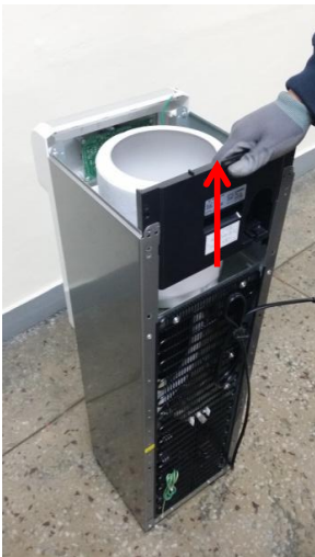
10-2) 背面固定板を上方向に挙げて取り外します。