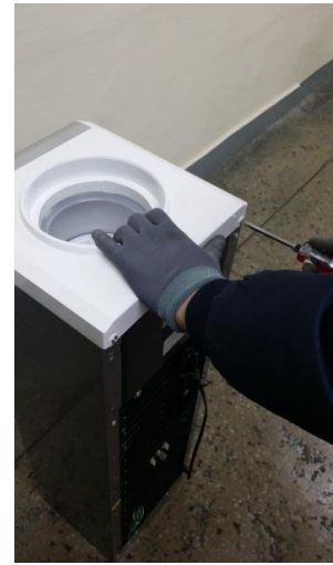
8) 上パネルの背面のネジ2個を取り外してください。