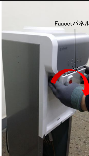
4-1) Faucetパネルを両手で握って下方向に回す感覚で引っ張ります。