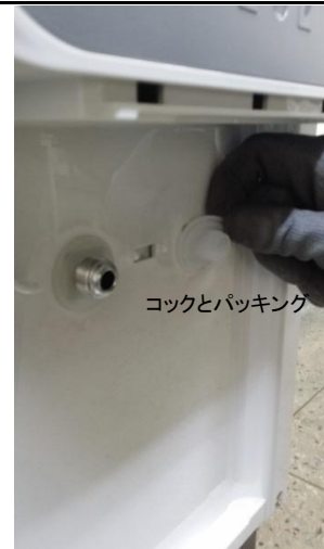
6) 꼭지와샤패킹 2개를 분리하세요